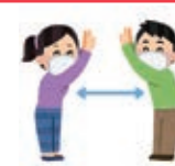
ソーシャルディスタンス